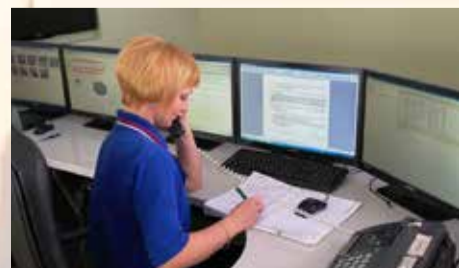
ЕДИНАЯ ДИСПЕТЧЕРСКАЯ СЛУЖБА ПО ВОПРОСАМ ЖКХ