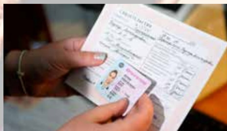
ПРОЦЕДУРА ЗАМЕНЫ ВОДИТЕЛЬСКОГО УДОСТОВЕРЕНИЯ