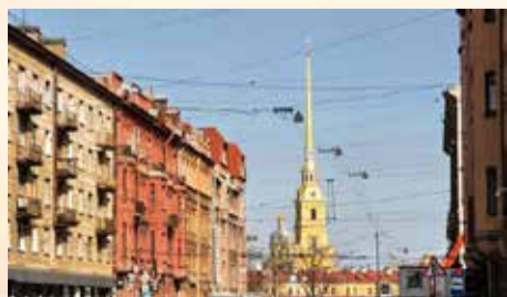
О РЕЗУЛЬТАТАХ ВЫЕЗДНЫХ СОВЕЩАНИЙ НА ПЕТРОГРАДСКОЙ СТОРОНЕ