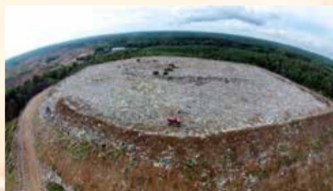
МУСОРНЫЙ ПОЛИГОН СТАНЕТ ИСПЫТАТЕЛЬНЫМ