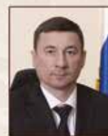
Пригода Н.А. Глава администрации Петроградского района