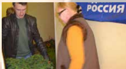
УКРАСИМ ВМЕСТЕ НАШ ЛЮБИМЫЙ ОКРУГ!