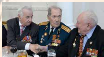
ПРАЗДНИЧНЫЕ ОБЕДЫ ПРОШЛИ В МО ВВЕДЕНСКИЙ