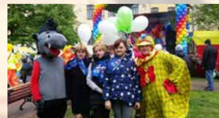
1 ИЮНЯ – ДЕНЬ ЗАЩИТЫ ДЕТЕЙ